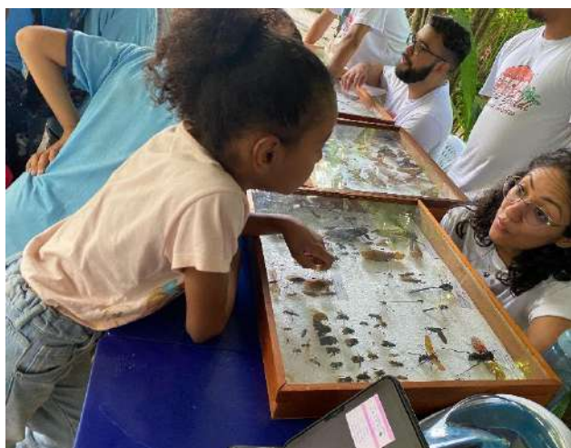
Imagem 01: Criança interagindo com a pesquisadora de entomologia

A programação reúne uma diversidade de linguagens e metodologias, que incluem oficinas de educação ambiental, arqueologia, botânica e zoologia; demonstrações científicas conduzidas pelos pesquisadores; visitas mediadas às exposições permanentes e aos viveiros do Parque Zoobotânico; além de ações de ciência cidadã e experimentações lúdicas. Cada uma dessas atividades é planejada para estimular a curiosidade, promover o diálogo entre saberes tradicionais e acadêmicos e envolver o visitante como protagonista do próprio processo de descoberta, reforçando o caráter democrático e participativo do evento.