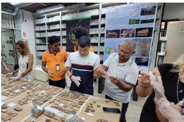
Imagem 07: Pessoas com deficiência visual participando da roda de conversa preparatória para o MPA virtual interagindo com pesquisadores de arqueologia na reserva técnica.