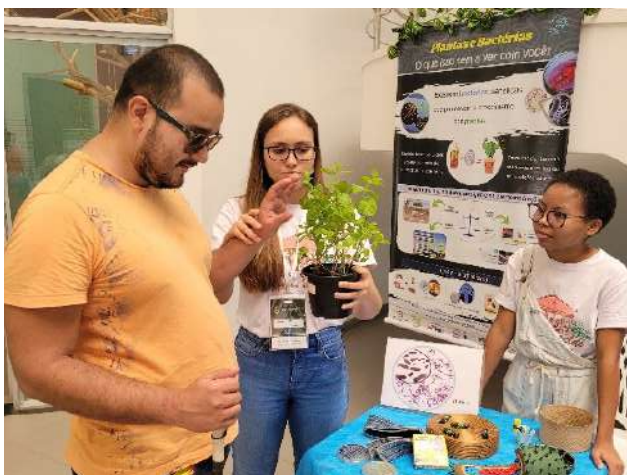
Imagem 06: Pessoa com deficiência visual interagindo com pesquisadores de botânica

e à cultura integrou as atividades ligadas às elites e aos intelectuais, mas, na atualidade, os espaços culturais e artísticos invadiram a vida da população em geral por meio das políticas de acesso, necessárias à sua legitimação na contemporaneidade.” (Sarraf, 2010, p. 154). Essa reflexão dialoga diretamente com os esforços do Portas Abertas, que, ao ampliar suas estratégias de acessibilidade, fortalece sua função social e reafirma que a ciência e a cultura amazônica pertencem a todos os públicos.