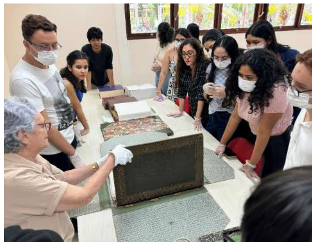
Imagem 02: Estudantes conhecendo as Obras Raras do MPEG

Ao integrar práticas interativas, mediações críticas e vivências diretas com o patrimônio natural e cultural, o Museu Goeldi de Portas Abertas configura-se como uma ação educativa que transcende a simples apresentação de conteúdo. Ele cria um ambiente de encontro, escuta e experimentação, reafirmando o compromisso institucional com a popularização da ciência e com a formação de públicos mais críticos, sensíveis e socialmente engajados.