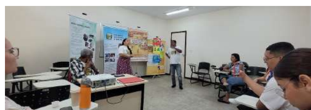
Imagem 09: Conselheiros do Ponto de Memória da Terra firme dialogando com estudantes da Escola Estadual Brigadeiro Fontenelle em preparação para o MPA 2025

“A partir do Programa Pontos de Memória, organizado pelo Ministério da Cultura e Instituto Brasileiro de Museus em 2009. Essa visibilidade fez com que a comunidade da Terra Firme construísse o Primeiro Ponto de Memória da Região Norte. No entanto, sem nunca abandonar as atividades no Goeldi” (Alcântara et al., 2025, p. 225). As ações conjuntas desenvolvidas com o Ponto de Memória demonstram a potência da participação comunitária nas atividades educativas do Museu. A presença de lideranças, conselheiras e moradores da Terra Firme em ações formativas, rodas de conversa e atividades culturais contribui para a construção de vínculos afetivos e simbólicos entre comunidade e instituição assim, “... em tempo algum, perdeu um dos seus principais vínculos, que se deu, como visto inicialmente, com os moradores do bairro da Terra Firme. Com o seu avanço, a comunidade continuou sendo uma das principais parcerias e protagonistas do Programa” (Silva; Quadros, 2025, p. 29). Essas práticas revelam que a memória social e a produção científica podem ser articuladas de forma horizontal, valorizando a multiplicidade de vozes que compõem o território amazônico.