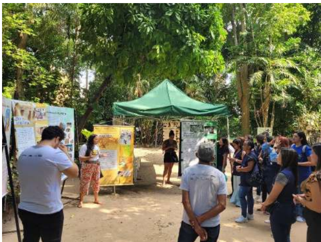
Imagem 10: Conselheira do Ponto de memória da Terra Firme interagindo com grupo de acadêmicos.

Essa parceria também fortalece uma abordagem de museologia social alinhada às perspectivas contemporâneas da educação museal. Ao reconhecer os moradores da Terra Firme como sujeitos de memória e parceiros ativos na construção das ações educativas, o Museu Goeldi reafirma compromissos previstos na Política Nacional de Educação Museal, especialmente no que diz respeito à participação social, ao fortalecimento comunitário e ao reconhecimento das identidades culturais. Além disso, essa colaboração contribui para práticas decoloniais, deslocando o foco da autoridade científica exclusivista e abrindo espaço para múltiplas epistemologias presentes no território.