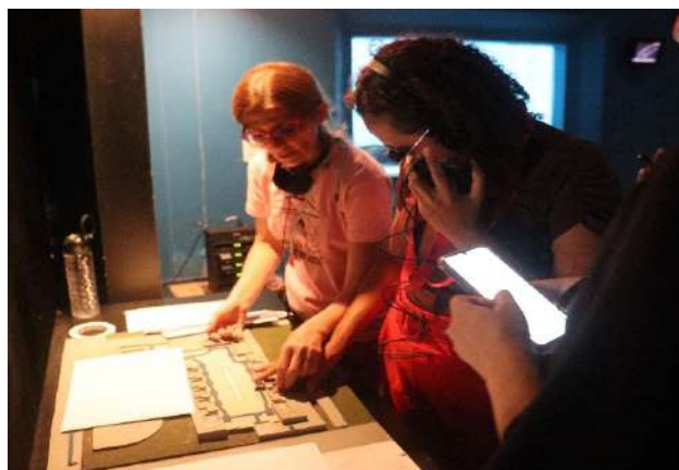
Imagem 08: Pessoa com deficiência visual interagindo com o mapa tátil no aquário Jacques Huber e com a Pesquisadora de coordenação de museologia.

Nesse sentido, o programa busca incorporar recursos inclusivos em suas atividades, como o uso de LIBRAS nas exposições e de intérprete as pessoas que necessitam, a oferta de materiais táteis, o emprego de linguagem acessível e a utilização de suportes visuais que facilitam a compreensão dos conteúdos. Além disso, seu desenho educativo considera a participação de múltiplos perfis socioculturais, incluindo pessoas com deficiência, crianças, idosos, moradores urbanos e comunidades tradicionais, garantindo que a experiência museal seja vivenciada de forma plena e significativa. Ao articular tais estratégias, o Museu Goeldi de Portas Abertas consolida-se como um espaço que não apenas divulga ciência, mas promove a justiça social e o direito ao acesso cultural.