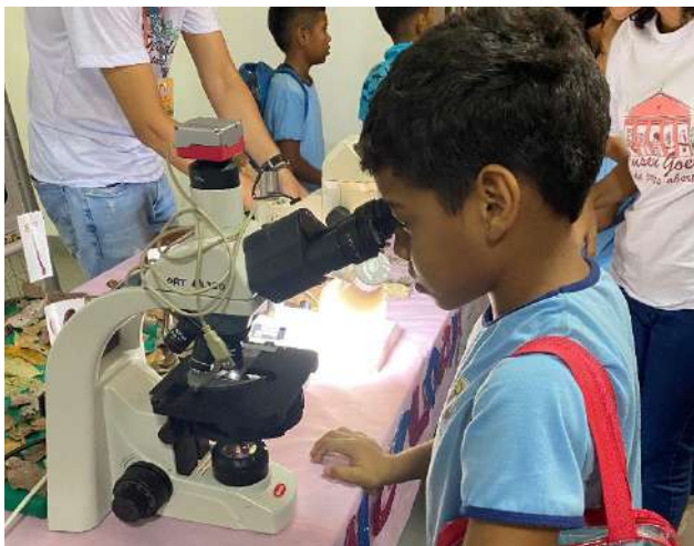
Imagem 03: Criança interagindo com equipamento microscópio e com pesquisadora que estuda fungos.