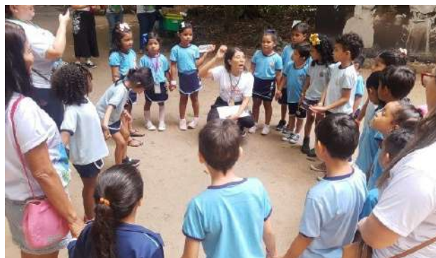
Imagem 04: Grupos de estudantes da educação infantil (acima) e estudantes de graduação (abaixo)

anuais integram atividades interativas, mostras científicas educativas, oficinas e exposições, cujos temas dialogam com a Semana Nacional de Ciência e Tecnologia (SNCT), promovida pelo Ministério da Ciência, Tecnologia e Inovações (MCTI). O conjunto dessas ações reafirma o caráter formativo do programa e sua relevância